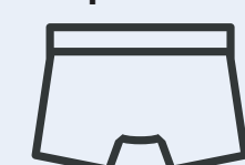
Boxer de bain