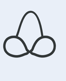
Maillot 2 pièces

ENFANTS : admis à partir de 5 ans sur présentation d'un justificatif d'âge. Les enfants de 5 à 16 ans doivent être obligatoirement accompagnés par un adulte. Ils sont placés sous la responsabilité des parents ou des personnes qui les accompagnent dans la limite de 3 enfants par adulte. Ils doivent rester en permanence à proximité de ce dernier, lequel a une obligation de surveillance constante. L'accès aux saunas, hammams, aux cours d'aquagym, d'aquabike d'aquatraining et d'aquapilates leur est autorisé à partir de 17 ans.